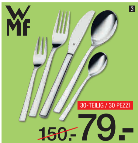
3. Besteck-Set , 30-teilig, im zeitlosen Design, aus rostfreiem, spülmaschinenfestem Cromargan®. 200140 3. Set di posate da 30 pezzi , design intramontabile, in Cromargan® inossidabile e lavabile in lavastoviglie.