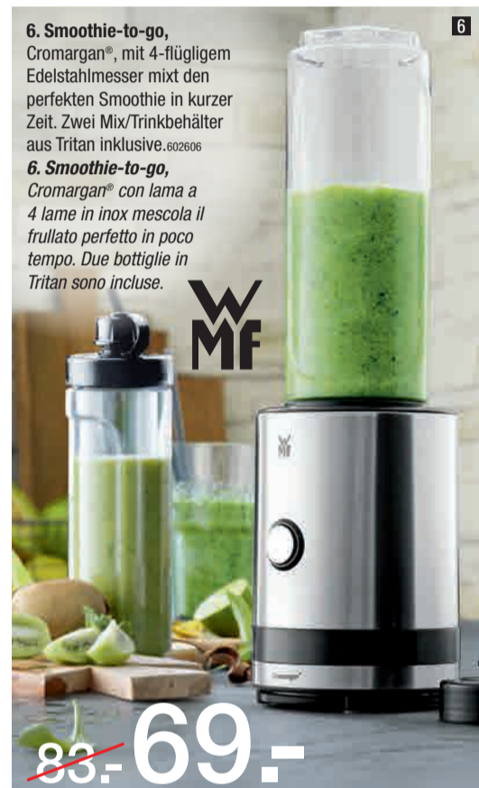
6. Smoothie-to-go , Cromargan®, mit 4-flügligem Edelstahlmesser mixt den perfekten Smoothie in kurzer Zeit. Zwei Mix/Trinkbehälter aus Tritan inklusive. 602606 6. Smoothie-to-go , Cromargan® con lama a 4 lame in inox mescola il frullato perfetto in poco tempo. Due bottiglie in Tritan sono incluse.