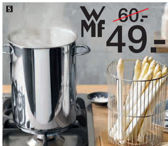
5. Spargeltopf/Pastatopf , ø ca. 16cm a. 4,5l, Schütt- rand, Cromargan® Edelstahl, mit Sieb und Glasdeckel. 700941 5. Casseruola per asparagi/pasta , ø ca. 16cm, 4,5l, bordo antigoccia in acciaio inox Cromargan®, con scolapasta e coperchio in vetro.