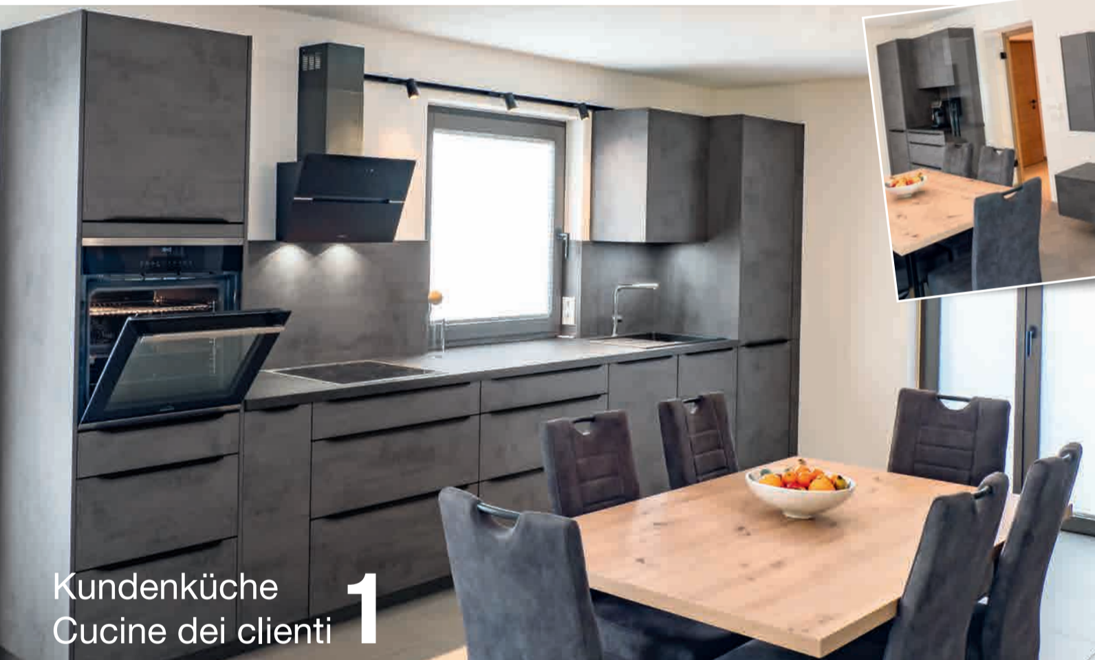
Kundenküche Cucine dei clienti 1