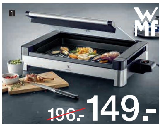
1. Tischgrill aus Cromargan® Edelstahl, elektrisch mit Glasdeckel, beschichteter Grillplatte, herausnehmbare Auffangschale, spülmaschinenfest, 2200Watt, ca. 42x60cm. 601872/8 1. Elegante grill in acciaio Cromargan®, elettrico con coperchio in vetro, vassoio raccogli grasso facile da rimuovere, adatto per lavastoviglie, 2200W, ca. 42x60cm.

WMF UNSER STARKER PARTNER! IL NOSTRO PARTNER FORTE!