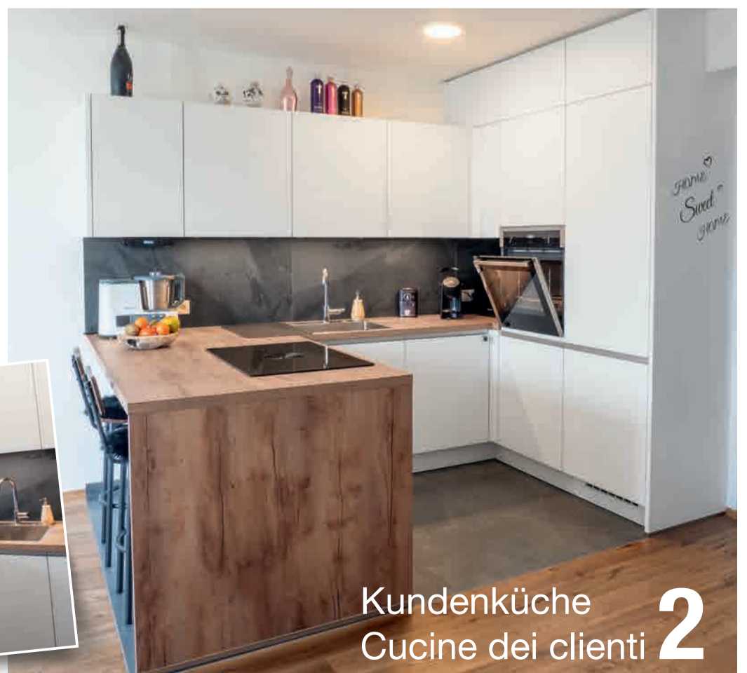
Kundenküche Cucine dei clienti 2

La nostra nuova cucina è moderna e accogliente. Un sentito ringraziamento a Mobili Planer per averci suggerito il mix di materiali.