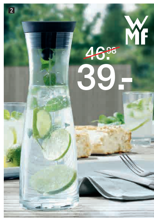
2. Glaskaraffe , 1L, mit Schwenkverschluss CloseUp und integriertem Sieb für tropffreies Ausgießen. 200018 2. Caraffa in vetro , 1 l, con tappo orientabile CloseUp e filtro integrato antigoccia.