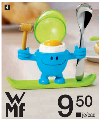
4. McEgg in blau, pink oder orange. 200017-/3 4. McEgg in blu, rosa e arancione.